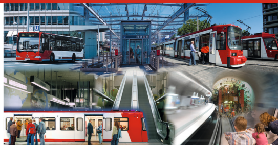
Stand: Januar 2018