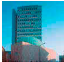
Hochhaus am Plärrer und Planetarium

Hier war 1835 der Startpunkt des „Adler“, der ersten deutschen Eisenbahn, die zwischen Nürnberg und Fürth fuhr. Am westlichen Rand befindet sich das unter Denkmalschutz stehende „Plärrer-Hochhaus“ – erbaut 1953, mit 56 Metern damals das höchste Gebäude Bayerns.