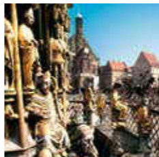
Hauptmarkt mit Schöner Brunnen

Während des Zweiten Weltkriegs wurde die 1230 erbaute St. Sebald-Kirche weitgehend zerstört, in den folgenden Jahren aber aufwendig wiederhergestellt. Im Inneren der Kirche sticht das Grab des St. Sebaldus hervor, dem Schutzheiligen Nürnbergs. Den Bronzeguss fertigten Peter Vischer und seine Söhne von 1508 bis 1509 an.