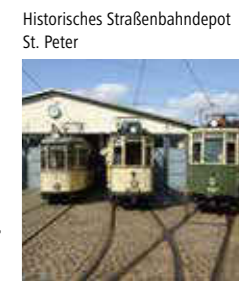
Historisches Straßenbahndepot St. Peter

Alle Fans der Straßenbahn kommen hier voll auf ihre Kosten: zu bestaunen sind die Entwicklungsgeschichte der Straßenbahn seit 1881 im Original und im Modell. Fahrten mit der historischen Burgringlinie 15 finden an jedem 1. Wochenende im Monat statt – im Januar geschlossen.