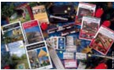
Ausgefallene Präsente für den Gabentisch halten die VAG-Kundenbüros bereit.

Oder Sie verschenken einen Tag beziehungsweise ein Wochenende in Nürnberg oder im VGN-Gebiet. Mit dem TagesTicket erreichen Sie die schönsten Ausflugsziele. Ideal für die ganze Familie ist das TagesTicket Plus. Damit können zwei Erwachsene und vier Kinder unter 18 Jahren, wenn es eigene sind auch mehr, einen Tag bzw. am Samstag gekauft, zwei Tage lang mobil sein. Wenn Sie nur zu zweit unterwegs sind, können Sie die Fahrräder mitnehmen oder den Hund. Ausflugsziele finden Sie in den zahlreichen Freizeitführern für das Verbandsgebiet zum Beispiel in dem Buch „Familienzeit“ oder im „Wirtshaus-Verführer“. Diese Geschenke und weitere VAG-Fanartikel, wie T-Shirts,