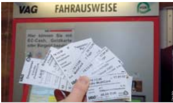
Neue Fahrkartenautomaten machen die Bezahlung der Tickets komfortabel und bequem mit EC-Karte möglich.

Die Investitionen in Höhe von insgesamt 2,3 Millionen Euro teilen sich die Stadt Nürnberg (U-Bahn-Bereich), die VAG (Oberfläche) und die infra fürth verkehr gmbh (Stadtgebiet Fürth). Ersetzt werden die ältesten im Einsatz befindlichen Automaten mit Zahlentastatur. Neuere Automaten dieses Typs mit Tastatur sowie auch die bereits vorhandenen Touchscreenautomaten, die der Kunde bisher schon über Berührungen des Bildschirms steuerte, bleiben weiterhin