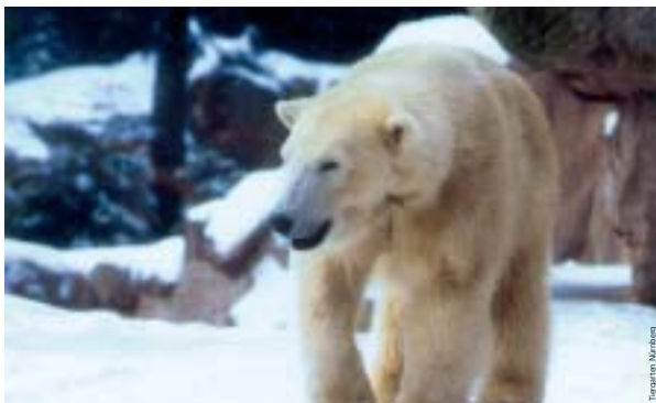
Eisbär und Co. machen den Besuch des Nürnberger Tiergartens auch im Winter zu einem besonderen Erlebnis.

Warm angezogen, kann der Rundgang beginnen. Je nachdem welche Tour man wählt, sollte man gut zu Fuß sein. Kinder setzen sich unterwegs gerne in die Bollewagen, die gegen eine Gebühr von drei Euro und einen Pfand von 20 Euro am Eingang zum Ausleihen bereitstehen. Rollstühle können bis 10.00 Uhr bei der Verwaltung vorbestellt werden. Im Tiergarten sind rund 2.000 Wildtiere von fünf Kontinenten zu Hause. Zu den neueren Anlagen gehören die Freigehege für Gorillas, Seelöwen, Pinguine, Otter, Biber und Eisbären sowie für Schneeleoparden. Dem Besucher präsentieren sich mitten in der fränkischen Winterlandschaft Zebras, Büffel und Antilopen. Auch Löwen, Tiger, Wölfe, Reptilien,