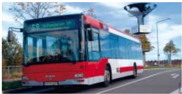
Die Buslinie 68 verbindet schon ab Dezember 2006 den Tillypark mit der U-Bahn-Haltestelle Rothenburger Straße.

Durch die Verknüpfung der bisherigen Linien 60 (Röthenbach – Bahnhof Eibach) und 66 (Röthenbach – Bremerhavener Straße) wird das neue Zollamt am Hafen besser an den ÖPNV angebunden. An der Haltestelle Königshof besteht nun eine gute Umstiegsmöglichkeit zur Linie 51/651, was vor allem für die Schü-