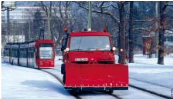
Die Winterrufbereitschaft der VAG sorgt auch bei tiefem Schnee dafür, dass Busse und Bahnen verkehren.

Ein großes Streugutstilo mit einem Fassungsvermögen von rund 100 Tonnen im VAG-Betriebshof Maximilianstraße, 18 Mitarbeiter sowie zwei Lkws mit Allradantrieb inklusive Streuanlage und Schaufel stehen in den Startlöchern. Mit den Räumfahrzeugen machen sie den Weg auf den Gleisen der Niederflurstraßenbahnen frei. Treppen und Eingänge der U-Bahnen werden rund um die Uhr im Auftrag der VAG von externen Reinigungsfirmen geräumt und gestreut. Hier wird mit Liapor gearbeitet, einem speziellen Ton. „Salzstreuen ist prinzipiell verboten, außerdem werden viele Räumarbeiten