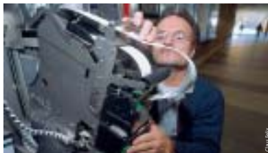
Zukünftig weiß der VAG-Mitarbeiter, wo demnächst das Papier knapp wird.

künftig jedes Gerät online Statusmeldungen durch, aus denen unter anderem hervorgeht, ob ihm bald der Münzvorrat oder das Papier für den Fahrscheindruck ausgeht. Der Logistik-Mitarbeiter kann sich diese Informationen in Zukunft gleich morgens ausdrucken und seine Tour entsprechend planen. Da so viele Wegzeiten wegfallen, werden aus den bisher drei Touren dann je eine Tour im Norden und eine im Süden, in welche die U-Bahnhöfe jeweils mit integriert sind. ■