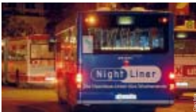
Die „Gute-Nacht-Bussis“ versüßen Nachtschwärmern den Jahreswechsel.

Für die alljährlich betriebsame Silvesternacht hat die VAG besonders vorgesorgt: Da fahren sämtliche Nürnberger und Fürther Nachtbusse sogar im 30-Minuten-Takt und mit 1.00 und 2.00 Uhr fahren die Linien N1 bis N15 ab Hauptbahnhof mit jeweils zwei Bussen. Zudem werden die U-Bahn-Linien U1 und U2 die ganze Nacht durch verkehren. Es auch an den Adventswochenenden verstärkt die VAG ihr Fahrtenangebot tagsüber. Mehr: www.vag.de . ■