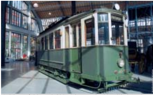
Die Nürnberger Straßenbahn veranschaulicht im Münchner Museum die Verkehrsgeschichte der 20er Jahre.

Liebhaber historischer Fahrzeuge, aber auch alle an der Zukunft der Mobilität interessierten Menschen haben ein neues Mekka: Das Verkehrszentrum des Deutschen Museums in München präsentiert in drei denkmalgeschützten Messehallen auf 12.000 Quadratmetern über 1.000 alte und neue Objekte – und eine alte Straßenbahn der VAG ist mit dabei. Ein Stück Nürnberger Verkehrsgeschichte steht in der Nähe des Ausgangs von Halle 1. Die Straßenbahn in dunkelgrün und beige mit dem Wagenkasten aus Eichenholz stammt aus den 20er Jahren. Sie gehört zu der von MAN und Siemens hergestellten Baureihe, die mit über 100 Wagen lange Zeit das Rückgrat der Nürnberg-Fürther Straßenbahn bildete. Jetzt bringt die Schenkung der VAG, eine von vier historischen Straßenbahnen, neben vielen anderen Objekten, den Besuchern des Museums auf der Thesenstiege den „Verkehr in der Stadt“ nahe. In der gleichen Halle kann man den Verkehr aus der Perspektive eines Lkw-Fahrers erleben oder Einblicke in ein Klinikomobile, eine fahrbare Zahnarzt-