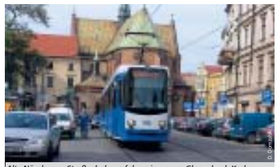
Alte Nürnberger Straßenbahnen fahren in neuem Glanz durch Krakau.

„Die Krakauer Kollegen hatten in kürzester Zeit schon ganze Arbeit geleistet, die Radreifen erneuert, neue Sitze und Zugzielanzeigen eingebaut und die Wagen umlackiert“, erinnert sich Scheuerle bewundernd. „Aber die Elektronik war ihnen eben nicht vertraut.“ Alle zehn Minuten vom Schrei eines virtuellen, Tauben verscheuchenden Habichts beglei-