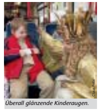
Überall glänzende Kinderaugen.

und von 15.00 bis 16.00 Uhr den Christkindlesmarkt. Neu in diesem Jahr: Freitags und sonntags jeweils von 14.30 bis 15.00 Uhr ist das Christkind ebenfalls auf der Kinderweihnacht anzutreffen, von 15.00 bis 16.00 Uhr auf dem Hauptmarkt. Wer keine Gelegenheit hat, das Christkind live zu erleben, kann es auch im Fernsehen bewundern. Am 9. Dezember bei der Bayerischen Weihnacht in der ARD. ■