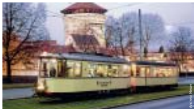
Stimmungsvoll sind die Glühweinfahrten an den Adventswochenenden.

man die schönsten historischen Straßenbahnfahrzeuge seit 1881. Nachdem das Depot im Januar geschlossen hat, gibt es dann am 3. und 4. Februar 2007 von 10.30 bis 16.30 Uhr wieder die Rundfahrten um die Nürnberger Altstadt. Ab dem 4. März 2007, jeweils sonntags um 14.00 Uhr nehmen auch wieder die historischen Omnibusse Themenfahrten in unterschiedliche Stadtteile Nürnbergs auf. Im März führt die Tour über das ehemalige Reichsparteitagsgelände, im April entlang der Straßenbahnlinie 8 und im Mai in den Stadtteil Schlegling. Ausgangspunkt ist das Historische Straßenbahndepot St. Peter. Informationen und Reservierungen unter Telefon 09 112/83-4654. ■