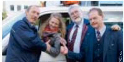
Teamarbeit: das himmlische Christkind mit seinen irdischen VAG-Gehilfen.