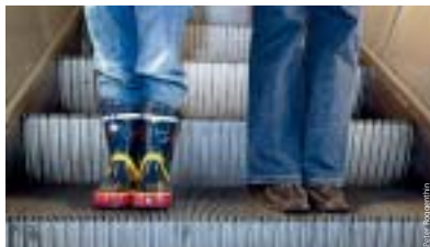
Mit genug Abstand zu den Seiten und an Mamas Hand passiert nichts.

mit einem aufgeschlitzten Gummistiefel, was passieren kann, wenn Kinder auf der Rolltreppe herumalben oder unachtsam sind. Die Stiefel können seitlich hineingezogen werden. Deshalb sollten Kinder mit Gummistiefeln immer in der Mitte der Treppenstufe stehen bleiben und sich gut festhalten. Gleiches gilt für Flipflops, Turn- und Freizeitschuhe mit Gummisohlen. Tiere sollten grundsätzlich auf den Arm genommen werden. ■