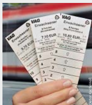
Die drei Mehrfahrtenkarten.

Im Januar 2012 können alte 10er-Streifenkarten noch in Nürnberg, Fürth und Stein abgefahren werden. Danach können 10er-Streifenkarten, die nicht mehr gebraucht werden – etwa weil ein Fahrgast nie mit dem ÖPNV aus dem Tarifbereich A hinausfährt –, im VAG-KundenCenter zurückgegeben werden. ■