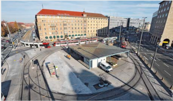
Ein attraktives Liniennetz mit dichten Takten, moderne Fahrzeuge und Anlagen zeichnen den ÖPNV in Nürnberg aus.

Notwendig sind die Änderungen, weil das Angebot in den Städten sehr viel größer ist als im übrigen VGN-Gebiet. Außerhalb Nürnbergs gibt es ein wesentlich dünneres Liniennetz. Busse und Bahnen verkehren dort nicht so oft. Das bessere innenstädtische Angebot verursacht erheblich mehr Kosten und am Ende des Geschäftsjahres ein beträchtliches