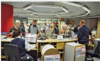
Mitarbeiter des VAG-KundenCenters helfen gerne bei der Ticketwahl.

Mit dem Pkw ist die kürzeste Strecke von der Hardhöhe nach Fischbach laut Routenplaner rund 21 Kilometer lang. Wenn man einen