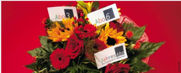
Ein Abo, egal ob für drei oder sechs Monate oder ein ganzes Jahr, ist ein zuverlässiger Begleiter im ÖPNV.

tungsdauer. Dazu muss man einen gültigen Ausweis und ein Lichtbild mitbringen. Oft fällt es Kunden gerade während einer Kontrolle auf, dass ihr Abo fehlt. Wenn sie sich im KundenCenter ein neues Abo ausstellen lassen, fällt zu den 30 Euro keine zusätzliche Gebühr für die Nachbearbeitung der Kontrolle an. Wer den Verlust beim Einstieg in den Bus bemerkt, muss einen Fahrschein kaufen. Denn hier muss man einen gültigen Fahrschein vorzeigen. Dieser wird laut Beförderungsbedingungen nicht zurückersetzt, wenn man sich ein neues Abo ausstellen lässt oder das alte wiederfindet. ■