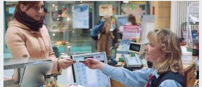
Aufkleber für Verbundpass oder Zonenkarte gibt es im VAG-KundenCenter.

Zeitkarten mit höherer Tarifstufe bleiben von der Einführung der Tarifstufen A und Z unberührt. Sie berechnen weiterhin zu beliebig vielen Fahrten innerhalb der im Verbundpass eingetragenen Zonen. Sind auch die Zonen 100 + 200 eingetragene, sind automatisch die neuen Tarifstufen A und Z enthalten und das Abo kann uneingeschränkt für Fahrten innerhalb von Nürnberg, Fürth und Stein genutzt werden. ■