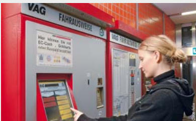
Das Ticketangebot am Fahrkartenautomaten bleibt unverändert groß.

Unter www.infra-fuerth.de oder im Kundenbüro am Fürther Hauptbahnhof gibt es weitere Informationen. ■