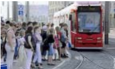
An Haltestellen: genug Abstand halten, nicht drängeln und nicht schubsen!

Die Schulranzen stehen ordentlich aufgereiht auf dem Gehweg. Die dazugehörigen Kinder spielen derweil Fangen an der Bushaltestelle. Eine Situation, wie sie jeden Morgen vorkommt. Auf den ersten Blick erscheint sie harmlos. Doch was passiert, wenn eines der Kinder stolpert und auf die Fahrbahn gerät?