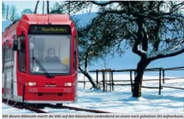
Mit diesem Bildmotiv macht die VAG auf den klassischen Liederabend an einem noch geheimen Ort aufmerksam.

VAG-Abo-Kunden erhalten gegen Vorlage ihres JahresAbos eine Ermäßigung von 25 Prozent im KundenCenter der VAG am Hauptbahnhof. ZAC-Karteninhaber erhalten die gleiche Ermäßigung bei den ihnen bekannten Vorverkaufsstellen. Für die Veranstaltung gilt die VGN-KombiTicket-Regelung. ■