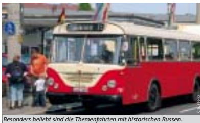
Besonders beliebt sind die Themenfahrten mit historischen Bussen.

Am 15. Oktober findet erneut die Veranstaltung „Blaulicht, Bus und Bahn“ statt, bei der das historische Straßenbahndepot St. Peter zusätzlich zwei Tage lang geöffnet hat. Aber auch die Feuerwehr, das Rote Kreuz und zahlreiche Vereine und Museen gewähren dabei Einblick in Geschichte und aktuelle Aufgaben. Am Freitag, 20. Oktober beteiligen sich VAG und Straßenbahnfreunde am Tag der älteren Generation mit einem Informationsstand an der Meistersingerhalle. ■