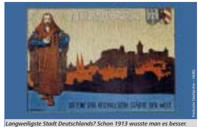
Langweiligste Stadt Deutschlands? Schon 1913 wusste man es besser.

So ist das Bamberger Domkreuz Belg dafür, was mit fränkischen Kunstschätzen geschah, nachdem die fränkischen Gebiete dem Bayerischen Fürsten unterstellt worden waren, und welche Folgen es für sie hatte, die Reichsunmittelbarkeit zu verlieren. Die Ausstellung, Dienstag bis Sonntag, ist mit der Straßenbahnlinie 8 (Erlenstegen-Worzeldorfer Straße) erreichbar. Für Erwachsene kostet der Eintritt sechs Euro. Wer mit öffentlichen Verkehrsmitteln kommt, bezahlt dagegen fünf Euro. ■