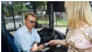
„Die Fahrschein bitte“, heißt es seit Sommer auf fast allen VAG-Buslinien.

Andrang oder bei Verspätungen entscheidet der Fahrer, ob er nach einer Ansage über Außenlautsprecher auch die hinteren Türen zum Einstieg freigibt. Denn Pünktlichkeit, guter Service und Sicherheit bleiben vorrangig. Kunden mit Kinderwagen, im Rollstuhl, mit schwerem Gepäck, Gehhilfe oder Fahrrad, für die der Einstieg vorne zu umständlich oder gar nicht möglich ist, werden gebeten, sich in Höhe der zweiten Tür für den Fahrer gut sichtbar aufzustellen. Dann wird dieser die Tür unauffordernd für diese Kunden öffnen.