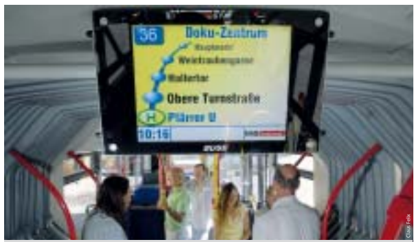
Schwarz, gelb und blau machen die Anzeige kontrastreich und für Menschen mit Sehbehinderung gut lesbar.