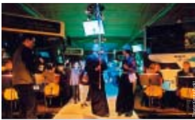
Klassisches Spektakel der besonderen Art in Linienbussen: der Wal.

Einen weiteren Höhepunkt im Jubiläumsjahr „125 Jahre Nahverkehr in Nürnberg“ gibt es am 14. und 15. Oktober 2006 in der VAG-Buswerkstatt und im VAG-Busbetriebshof Schweinau. Zwei Tage lang dreht sich alles um die Busse der VAG – historische wie moderne.