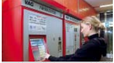
Bequem mit der EC-Karte zahlen. Die neuen Automaten machen's möglich.

Die VAG hat zwei der neuen Automaten bereits getestet. Fast jeder dritte Käufer an diesen Automaten nutzte die neue Zahlungsvariante EC-Cash. Noch in diesem Jahr werden acht an stark frequentierten U-Bahnhöfen aufgestellt. Weitere 70 folgen im Frühjahr 2007. Sie werden – wie ab Frühjahr alle VAG-Automaten – online fernüberwacht und teilweise auch fernwartet. ■