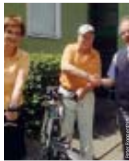
Die Posts: mit VAG-Rat aufs Rad.

Hausbesuche finden nur auf Wunsch statt. Einem Hausbesuch geht immer ein Schreiben voraus. Informationswünsche werden schriftlich oder telefonisch ermittelt. Termine für Hausbesuche werden immer telefonisch vereinbart. VAG-Berater sind stets in Dienstkleidung und am VAG-Dienstausweis zu erkennen. Nachfragen sind unter Telefon 09 11/283-46 53 möglich.