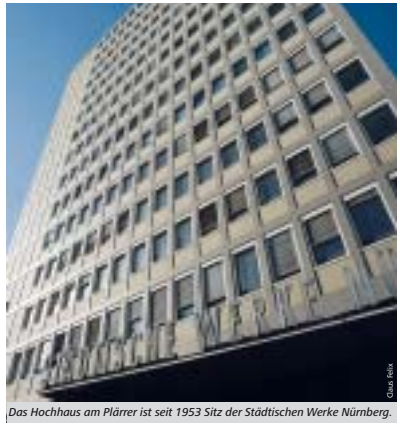
Das Hochhaus am Plärrer ist seit 1953 Sitz der Städtischen Werke Nürnberg.

Das „Nürnberger Modell“ sieht eine Aufteilung der VAG in eine Holding mit sieben Geschäftsbereichen für die Kernfunktionen eines Nahverkehrsmanagements und in drei ausgründete Betriebstöchter (Bus Nürnberg, Stadtbus Fürth und Stadtbus Erlangen) vor. Den Tochterunternehmen wird es dadurch ermöglicht, im Bedarfsfall Kooperationen mit anderen Unternehmen einzugehen. Die VAG ist weiterhin eine Eigenesellschaft der Stadt, im Aufsichtsrat haben die Stadträte die Mehrheit und mit dem Nahverkehrsplan und