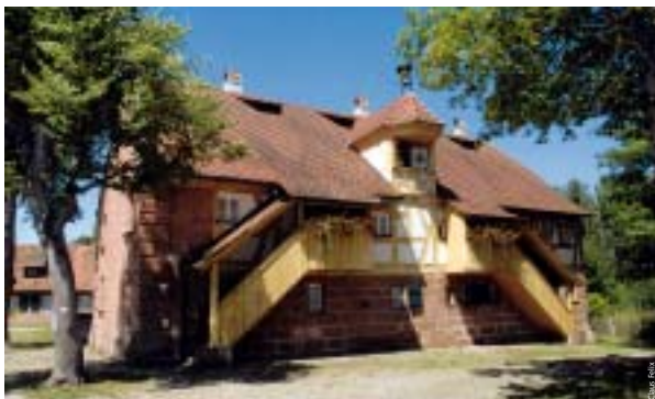
Das Uhrenhaus, einst Wohnhaus für die Arbeiter, ist heute dank umsichtiger Denkmalpflege wunderbar erhalten.

Erstmals erwähnt wird die Anlage als „Mühl zu Laufmühl“ im Jahr 1372. Daraus entwickelt sich bis ins 16./17. Jahrhundert hinein ein Messingwerk. Trotz der Zerstörungen des Ensembles im Zweiten Weltkrieg hat die Anlage bis heute ihren Charakter als befestigte Industriesiedlung bewahrt. Es finden sich Wehrtürme, ein Obelisk, die Reste des Herrenhauses von 1640 sowie Arbeiter- und Wohnbauten aus dem 17. und 18. Jahrhundert. Ein zentrales Gebäude ist das Uhrenhaus