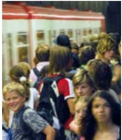
Im Schülerverkehr wird's täglich eng: VAG-Mitarbeiter sind dann vor Ort.

Dennoch sollten sich Eltern immer darüber im Klaren sein, dass Kinder die schwächsten Verkehrsteilnehmer sind. Ihre Fähigkeit, sich im Straßenverkehr richtig zu verhalten, wird oft überschätzt. Wer klein ist, sieht weniger und wird schlechter gesehen. Kinder haben im Vergleich zu Erwachsenen ein um 30 Prozent eingeschränktes Blickfeld und nehmen deshalb heranannahende Fahrzeuge erst spät wahr. Eine weitere Gefahrenquelle: Bis zum Alter von etwa acht Jahren können sich Kinder nicht in andere Verkehrsteilnehmer hineinsetzen und nehmen an, dass wenn sie selbst ein Auto sehen können, der Fahrer sie auch erkennt. Wichtig ist deshalb, mit den Kindern den Schulweg und die Benutzung von Bussen und Bahnen zu üben. Außerdem sollte man die Kinder morgens immer so rechtzeitig auf den Weg schicken, dass sie keine Angst haben müssen, den Bus oder die Bahn zu verpassen. ■