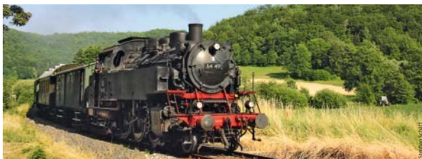
Die Fahrt mit einer Dampflokomotiv in der Fränkischen Schweiz ist ein besonderes Erlebnis für Kinder und Erwachsene.

schen Loks. Am Pfingstsonntag, 12. Juni, fährt eine Elektrolokomotive nach Garmisch-Partenkirchen. Dort bleiben bis zur Rückfahrt über fünf Stunden Zeit für eine Seilbahnfahrt auf die Zugspitze oder eine Wanderung durch die Partnachklamm. Start ist um 6.50 Uhr am Hauptbahnhof Nürnberg. Am Samstag, 9. Juli, bringt eine Dampflokomotive wie aus dem Bilderbuch Fans brasilianischer Rhythmen zum Samba-Festival nach Coburg. Die Abfahrt vom Nordostbahnhof Nürnberg ist um 13.50 Uhr, die Rückfahrt ab Coburg um 23.00 Uhr. Infos zu den Tickets gibt es unter 091 2790 22 28 oder online unter www.fme-ev.de . Neue Mitglieder sind übrigens bei beiden Vereinen willkommen. ■