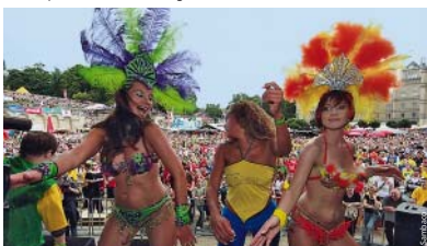
Warum in die Ferne schweifen... Das Samba-Festival bringt Rio nach Coburg.