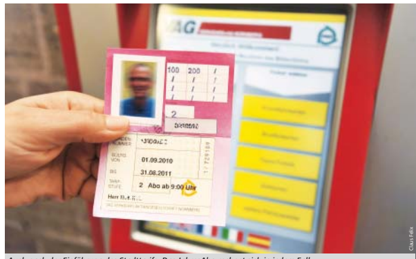
Auch nach der Einführung des Stadttarifs: Das JahresAbo rechnet sich in jedem Fall.

Die VAG plant im kommenden Jahr, möglichst zum 1. Januar 2012, einen Stadttarif einzuführen. Das ist notwendig, um das qualitativ hochwertige und attraktive ÖPNV-Angebot in Nürnberg weiter aufrechtzuerhalten und bedarfsgerecht auszubauen. Seit Jahren bemüht sich die VAG darum, ihr Defizit zu verringern. Rund 20 Millionen Euro konnten durch Personalabbau und geringere Löhne schon eingespart werden. „Doch Sparen allein reicht nicht mehr. Auch die Einnahmen müssen steigen“, zieht VAG-Vorstandsvorsitzender Herbert Dombrowsky Bilanz. Das sei vor dem Hintergrund weiter sinkender öffentlicher Zuschüsse dringend geboten. Die Änderungen betreffen alle Fahrten innerhalb des Stadtgebietes Nürnberg. Für Pendler aus dem Umland bzw. Nürnberger, die in die Region fahren wollen, ändert sich durch den Stadttarif nichts. Sie können wie bisher mit der VGN-Fahrkarte alle Verkehrsmittel nutzen. Die regelmäßigen Erhöhungen des VGN-Tarifs sind ebenfalls bereits in den Berechnungen zum Stadttarif berücksichtigt. Die Einführung des