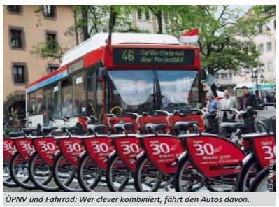
ÖPNV und Fahrrad: Wer clever kombiniert, fährt den Autos davon.

Dahlmann-Rensing: „Busse und Bahnen sind optimal für die Mehrzahl der Wege. Für die letzte Meile gibt es nun die Leihräder von NorisBike.“ Diese stehen vorrangig innerhalb der Ringstraße, in den Gewerbebezirken Nordost und Südwest sowie am Dutzendteich. Bei der Auswahl der Ausleihstationen hat die Stadt besonders auf eine Verknüpfung von ÖPNV und Fahrrad geachtet. „Das stärkt den Umweltverbund“, so Dahlmann-Rensing.