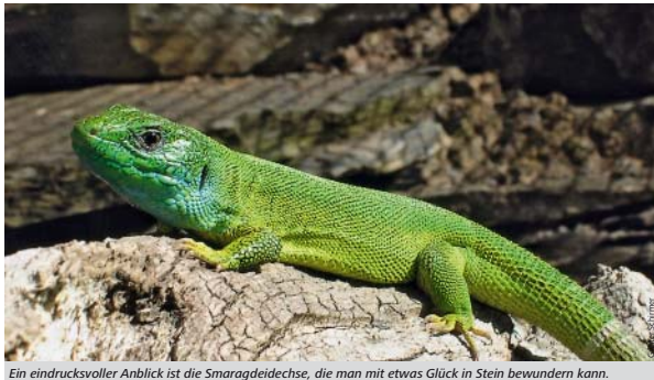
Ein eindrucksvoller Anblick ist die Smaragdeidechse, die man mit etwas Glück in Stein bewundern kann.

Viel zu sehen und zu lernen gibt es hier wie dort. Im Freiland-Aquarium und -Terrarium im Rednitzgrund können heimische, meist im Verborgenen lebende Tiere wie Schlangen, Kröten und Salamander in ihrer natürlichen Umgebung beobachtet werden. Eine Weiher-, Tümpel- und Sumpflandschaft mit üppiger Flora und Fauna lässt die nahe Stadt vergessen und bietet der europäischen Sumpfschildkröte wie der seltenen gelben Teichrose Heimat. Zudem zieht ein Aquarienhaus mit Süßwasserfischen wie Hechten und Flussbarschen die großen und kleinen Besucher an. Zu verdanken hat Stein die Anlage der Naturhistorischen Gesellschaft (NHG) Nürnberg. Der Eintritt ist frei. Die NHG freut sich aber über Spenden. Das Freiland-Aquarium und -Terrarium ist bis September an jedem Samstag, Sonn- und Feiertag von 9.00 bis 18.00 Uhr offen.