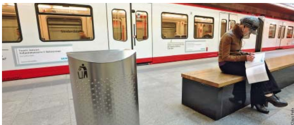
Auf einem sauberen Bahnhof fühlen sich Fahrgäste beim Warten auf die nächste U-Bahn wohler und sicherer.

Um ihre Fahrzeuge und U-Bahnhöfe kümmert sich die VAG selbst, die Reinigung der Haltestellen an der Oberfläche übernimmt der Servicebetrieb Öffentlicher Raum (SÖR) im Auftrag der VAG. Zusätzlich zur täglichen Reinigung ihrer Fahrzeuge hat die VAG vor zwei Jahren Zwischenreinigungen an den Endhaltestellen bzw. im Betriebshof eingeführt, und jeder U-Bahnhof wird bis zu drei Mal am Tag sauber gemacht. Sollten einmal ein verschmutzter Sitz oder ein überquellender Abfallbehälter stören, haben alle VAG-Mitarbeiter, ob Fahrer, Servicepersonal oder die Kollegen am Servicetelefon 09 11/283-46 46, ein offe-