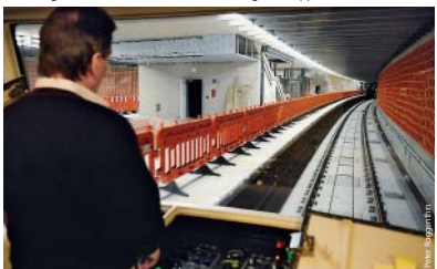
Erste Prüffahrt: Der U-Bahn-Zug fährt in den Bahnhof Friedrich-Ebert-Platz.

Betrieb. Siemens-Mitarbeiter testen mit einem Fahrzeug jede Funktion auf der Strecke – zum Beispiel das Kuppeln, Entkuppeln, Türöffnen und sämtliche Sicherheitsfunktionen. Ab Mitte Juni schickt Siemens mehrere Züge auf die Strecke. Im Sommer prüfen die Gutachter im Auftrag der Technischen Aufsichtsbehörde das System. Danach führt die VAG einen „Erprobungsbetrieb“ noch ohne Fahrgäste durch. Wenn im Dezember die ersten Fahrgäste einsteigen, soll schließlich alles möglichst reibungslos klappen. ■