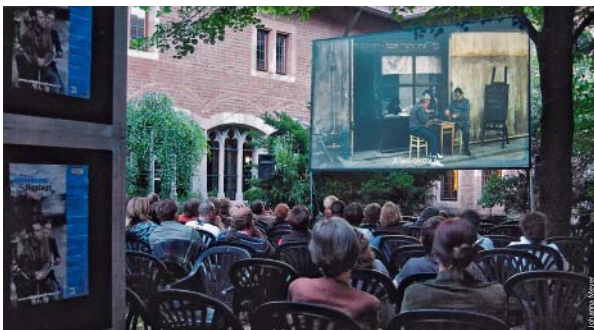
Romantische Kinonächte versprechen die Mittelmeerfilmreihe im Hof der Stadtbibliothek.

Los geht es am Freitag, 10. Juni mit dem Roadmovie „Stichtag“ mit Robert Downey Junior. Einen Tag später zeigen das Mobile Kino und Nürnbergbad „Eat, Pray and Love“. Spannend wird es am Freitag, 17. Juni bei dem Thriller „Unknown Identity“. Till Schweigers „Kokowääh“ läuft am Samstag, 18. Juni. Johnny Depp geht in „The Tourist“ zwar nicht baden, kommt am Freitag, 24. Juni aber trotzdem auf die Freibad-Leinwand. Zum Abschluss erzählt am 25. Juni „Der ganz große Traum“ von den schweren Anfangs-