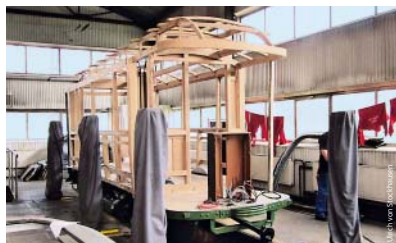
Der Beiwagen 336 nimmt mit dem Wagenkasten aus Eiche Gestalt an.

Freunde der Nürnberg-Fürther Straßenbahn e.V. und Krakauer Verkehrsbetriebe nicht nur bei diesem Projekt pflegen. Die typische Jugendstil-Lackierung und viele Details stehen noch an, bevor der Wagen im nächsten Jahr in Nürnberg für Rundfahrten eingesetzt werden kann. Auch wenn es auf das Ende der Restaurierungsarbeiten zugeht: Die Straßenbahnfreunde, die das Projekt durchführen und finanzieren, freuen sich über Spenden jeder Größe. Informationen gibt es unter www.bw336.de . ■