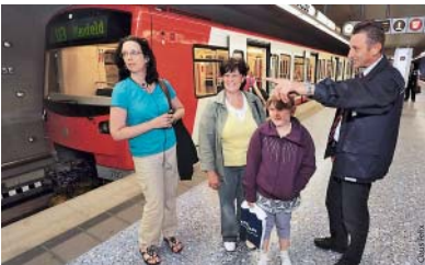
„Wo ist ...?“ Auch auf solche Fragen wissen die KUSS-Mitarbeiter oft Antwort.

Sie haben zudem eine Spezialausbildung, dank der sie viele Störungen am Fahrzeug selbst beheben können. Und wer Fragen etwa zu Tarifen oder zur Strecke hat, sollte nicht zögern, die KUSS vor Ort anzusprechen – sie helfen gerne. ■