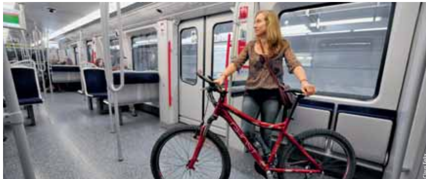
Ist genug Platz vorhanden, ist die Mitnahme von Fahrrädern in Bussen und Bahnen mit gültigem Fahrschein erlaubt.

Allerdings nur dann, wenn es für den Transport eine geeignete Stellfläche gibt. Ist der Platz knapp, haben Kinderwagen und Rollstuhlfahrer Vorrang. Bei den S-Bahnen ist die Fahrradbeförderung während der Verkehrsspitze von Montag bis Freitag zwischen 6.00 und 8.00 Uhr ausgeschlossen, ebenso in Regionalzügen ohne Mehrzweckabteil mit Fahrradsymbol. Pro Rad ist eine Kinderfahrkarte – Einzel- oder Mehrfahrtenkarte – zu lösen. Wer die MobiCard oder ein JahresAbo Plus besitzt, kann bis zu zwei Räder mitnehmen. Mit dem JahresAbo Plus ist die Mitnahme montags bis freitags aber erst ab 19.00 Uhr mög-