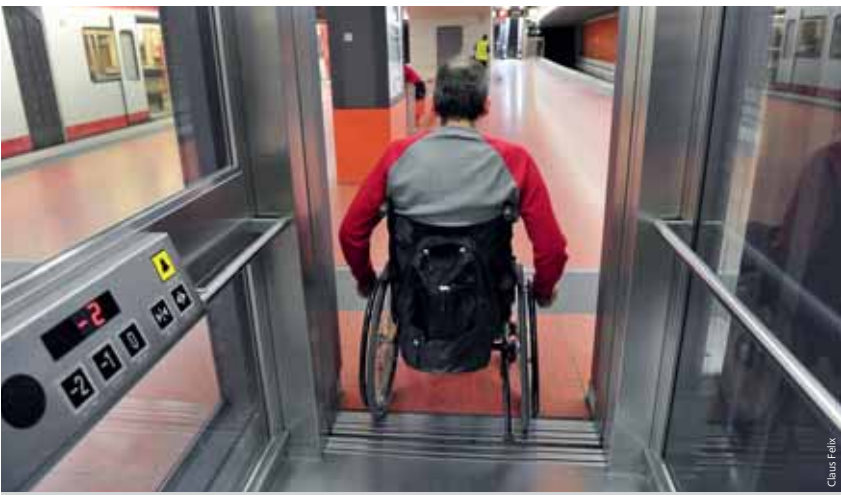
Die VAG steht für barrierearme Mobilität. Ist ein Aufzug defekt, haben Rollstuhlfahrer Anspruch auf ein Taxi.