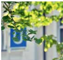
Ginkgo-Baum am Kaulbachplatz.

@ Infos unter baeume-fuer-die-menschenrechte.de ■