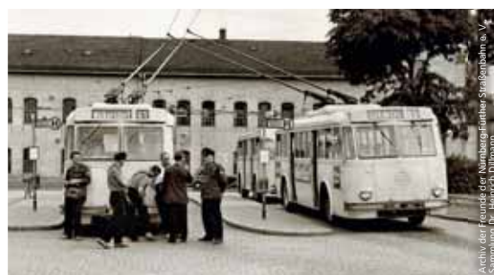
Im Jahr 1959 verkehrten in Nürnberg noch Obusse (Oberleitungsbusse).

In Bildern festgehalten sind die Fahrzeuge, von der ersten Pferdebahn bis zu den automatischen U-Bahnen, aber auch Betriebshöfe, technische Einrichtungen, Personen und Veranstaltungen. Ernst Wentzel, VAG-Betriebsleiter i. R. und einer der Väter der Nürnberger U-Bahn, hegt und pflegt mit drei Kollegen ehrenamtlich rund 35.000 Papierfotos, 20.000 Dias und 5.000 Negativstreifen, die sich im Historischen Straßenbahndepot St. Peter befinden. Sind Bilder aus privaten Spenden oder Ankäufen des Vereins neu zu archivieren, recherchiert er Daten wie Zeitpunkt und Ort der Aufnahme, vergibt Nummern und legt die Fotos in den Ordnern für die Bereiche Straßenbahn, Bus oder U-Bahn ab. Im Literaturarchiv werden neben Schriftdokumenten, Straßen- und Gleisplänen, technischen Zeichnungen, Zeitschriften und den Büchern der Vereinsbibliothek auch Infla-