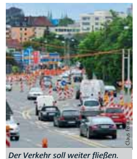
Der Verkehr soll weiter fließen.

rende Radweg bis Juli gesperrt. Der stadteinwärtige Radweg ist deshalb in beide Richtungen befahrbar.