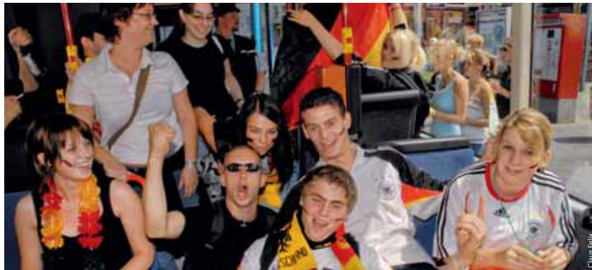
Sommermärchen 2006: Auf ähnlich gute Stimmung hofft die VAG, 2014 erneut Mobilitätspartner der Veranstalter.

Moderne Kamera- und Übertragungstechnik nebst einer 71 Quadratmeter großen Riesenleinwand auf einer zum WM-Fanpark umgestalteten, 15.000 Quadratmeter großen Parkfläche machen das Sommer-„Airlebnis“ unter Gleichgesinnten möglich. Das Schöne dabei: Der Fanpark am Airport ist wieder direkt mit der U-Bahn und dem Bus erreichbar. Die VAG verstärkt das Angebot. Live übertragen werden alle WM-Spiele der deutschen Nationalmannschaft, beginnend mit der Partie gegen Portugal am 16. Juni 2014. 20.000 Fußballbegeisterte fasst der