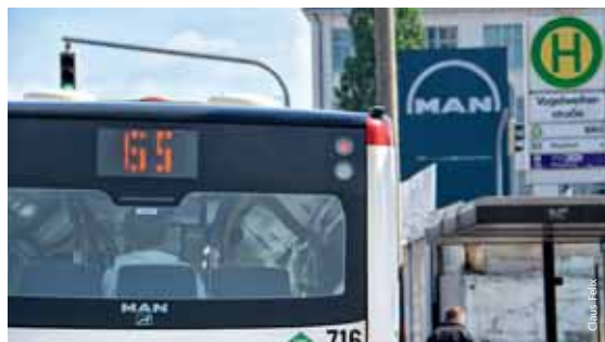
Das neue FirmenAbo gibt es für große und auch für kleine Unternehmen.

Die VAG bildet seit 2009 jedes Jahr Fachkräfte im Fahrbetrieb, kurz FiF, aus. Während der Ausbildung durchlaufen sie 27 Stationen. So sitzen sie hinter dem Steuer von Bus oder Bahn, lernen in den Werkstätten alles über die Fahrzeugtechnik und sind auch im Service tätig. Im Juli schließt bereits der vierte Jahrgang erfolgreich die dreijährige Lehre ab. Nach dem Abschluss ist den Fachkräften die Übernahme garantiert. Je nach Ausbildung fahren sie Bus, Straßenbahn oder U-Bahn und haben dann die Chance, sich weiter zu qualifizieren. Neugierig geworden? Beim VAG-Bewerberinformationstag am Freitag, 18. Juli 2014 von 13.00 bis 18.00 Uhr im Bildungszentrum Sandreuth erfährt man jede Menge über die FiF-Ausbildung. @ Einen Kurzfilm des Bayerischen Rundfunks über die Ausbildung gibt es unter: br-alpha.de , freie Stellen: ich-fahr-gut.de ■