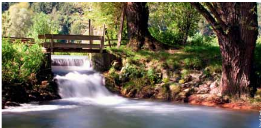
Ein Ausflug in die Natur rund um Kinding ist Kurzurlaub für die Sinne: mit dem VGN jetzt günstig und schnell.

Ab Nürnberg Hauptbahnhof kommt man seit Dezember 2013 mit dem VGN-TagesTicket günstiger als je zuvor und in unschlagbaren 27 Minuten nach Kinding. „Wir haben Erholungssuchenden viel zu bieten: ausgedehnte Wiesen und Wälder, die fürs Altmühltal typischen Wacholderhänge und schroffen Felsen, Burgen, Kirchen, die Altmühl und ihre Zuflüsse sowie ein vielfältiges Freizeitangebot“, wirbt Kindings Bürgermeisterin Rita Böhm für ihre Region. In Kinding, am Zusammenfluss von Anlauter, Schwarzach und Altmühl, befindet sich die größte und älteste Kirchenburg der Diözese Eichstätt. Die Burgruinen Rumburg und Rundeck oder das natürliche Felsentor in Untermendorf sind bei einem Tagesausflug leicht zu erlaufen. Zur Keltenburg