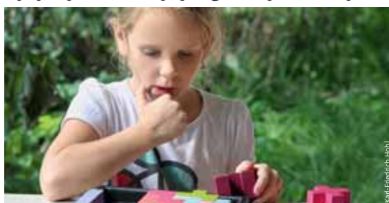
Die Station Denken in Bewegung fordert Kinder wie Erwachsene.

eine Zeitfahre und ein Luftlabor. Am 27. Juni öffnet das Erfahrungsfeld erstmals abends von 19.00 bis 24.00 Uhr, um das Jubiläum mit vielen Aktionen zu feiern. Von der Haltestelle Wöhrder Wiese der U2, U3 und Straßenbahnlinie 8 ist es ein kurzer Spaziergang zur besonderen Kulturstätte. @ erfahrungsfeld.nuernberg.de ■