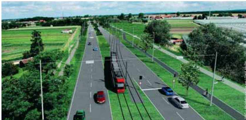
Die neue Straßenbahnstrecke mit Blick auf die Brücke am Götzenweg kurz vor der Endhaltestelle Am Wegfeld.

„Vom Ausbau des Straßenbahn- und Busnetzes profitieren Nürnberger wie Pendler aus dem Umland“, sagt VAG-Vorstandsvorsitzender Josef Hasler. Denn es wird künftig schnelle Verbindungen über die Straßenbahnlinie 4 oder über die Kombination von Bus und U-Bahn in die Innenstadt und weite Teile des Stadtgebietes geben. Die neuen Haltestellen sind gemäß VAG-Standard barrierearm und mit Blinden- und Sehbehindertenleitsystemen ausgestattet. Insgesamt erhoffen sich die Verkehrsplaner, dass die neue Strecke eine Entlastung des Straßenverkehrs