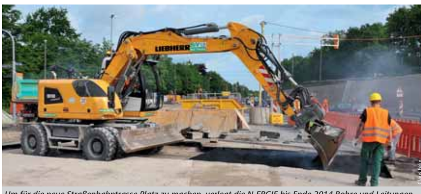
Um für die neue Straßenbahntrasse Platz zu machen, verlegt die N-ERGIE bis Ende 2014 Rohre und Leitungen.