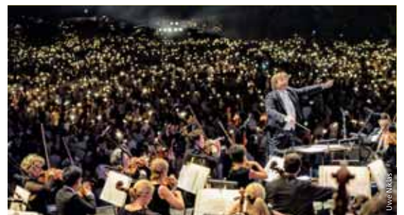
Europas größtes Klassik Open Air lockt alljährlich Tausende Besucher.

● Brückenfestival; Pegnitzwiesen unter der Theodor-Heuss-Brücke; 15. und 16. August; bietet: regionale und internationale Bands abseits des Mainstream, Kleinkunst und viele Spielmöglichkeiten für Kinder; Haltestelle: U-Bahnhof Maximilianstraße Linie U1. ■