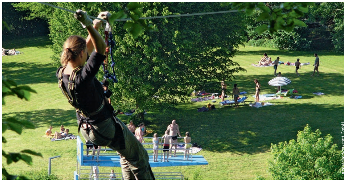
Für mutige Kletterfans: Hoch hinaus, über den Badegästen schwebend, geht es im Abenteuerpark Betzenstein.

Für Unerfahrene gibt es zwei Übungsparcours, auf denen sie Mitarbeiter bei den ersten Schritten anleiten, sowie einen ab sechs Jahren freigegebenen Felsenpfad mit