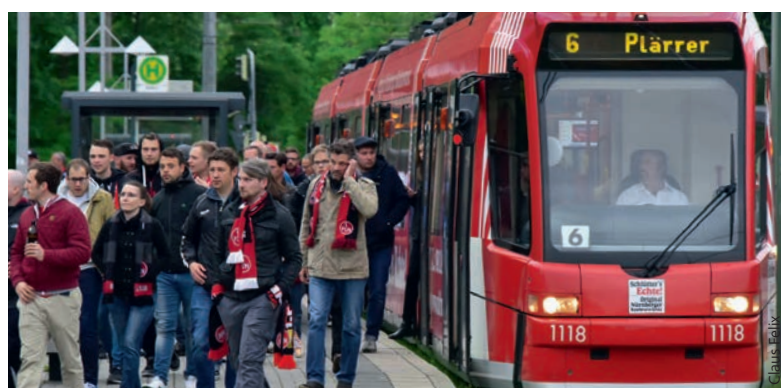
Fans nutzen bei Club-Spielen für die An- und Abfahrt gerne den ÖPNV.