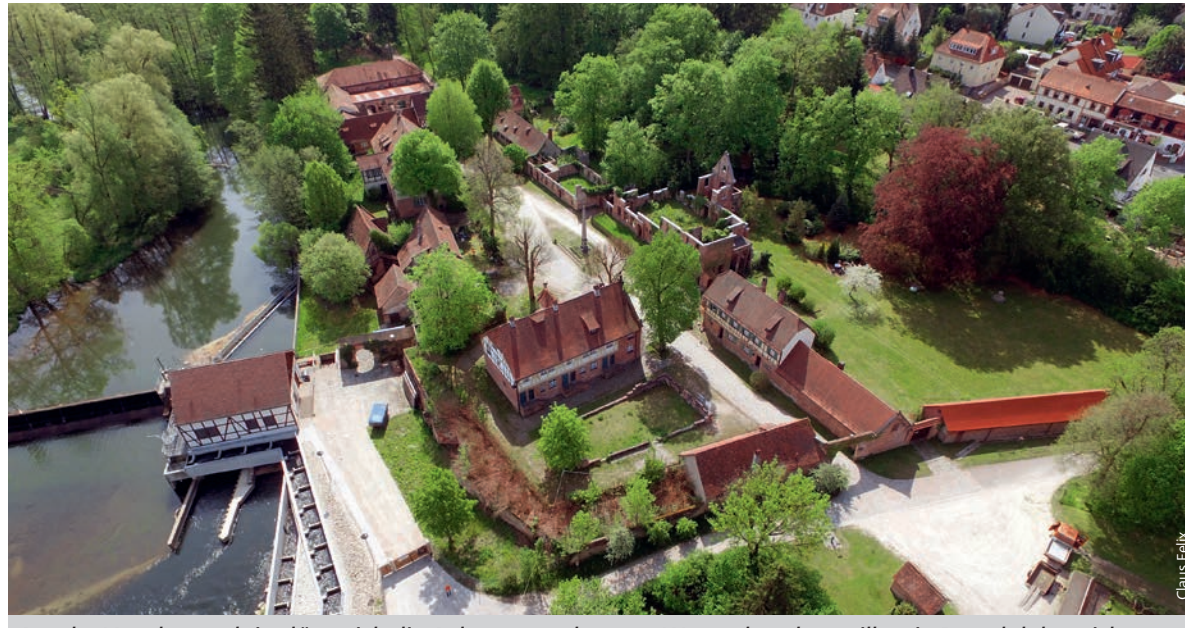
Aus der Vogelperspektive lässt sich die Anlage gut erkennen. Wer mehr sehen will – ein Besuch lohnt sich.

Die Arbeiter waren bereits im 16. Jahrhundert vorbildlich sozial abgesichert. Nach dem Gelübde, keine Betriebsgeheimnisse zu verraten, waren sie unkündbar und wohnten