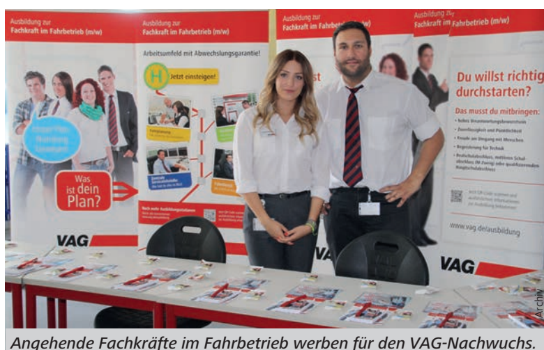
Angehende Fachkräfte im Fahrbetrieb werben für den VAG-Nachwuchs.

@ Mehr unter n-ergie.de/karriere sowie vag.de/ausbildung ■