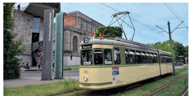
Mit der Linie 13 und einem Gästeführer Nürnberg ganz neu entdecken.

Die Fahrt dauert rund 90 Minuten, kostet 16 Euro für Erwachsene und 12 Euro für Kinder. Treffpunkt ist an der Straßenbahnhaltstelle C der Linie 9 am Nürnberger Hauptbahnhof. Infos und Tickets gibt es unter 0911 283-46 46 sowie unter vag.de/veranstaltung ■