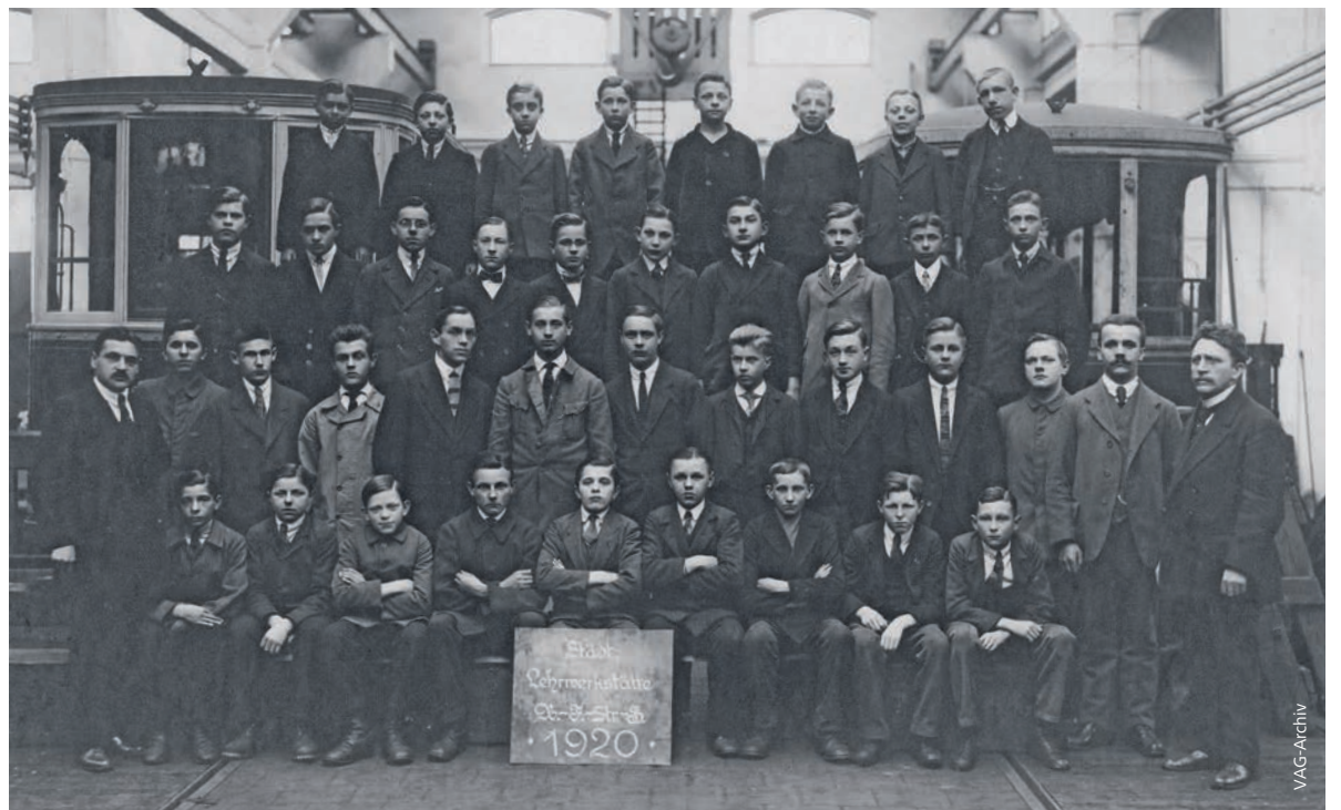
Lehrabschlussfeier 1920: Ausbildung und Berufsbilder haben sich verändert, aber die Verantwortung bleibt.

Die Berufsbezeichnungen und die fachlichen Ausrichtungen haben