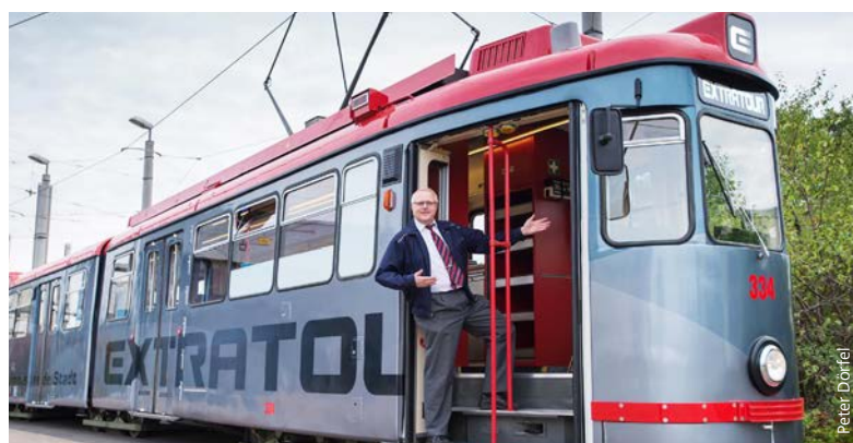
Tipp für den Sommer: Ein Ausflug durchs Stadtgebiet in der EXTRATOUR.

Weitere Informationen gibt es unter vag.de/extratour ■