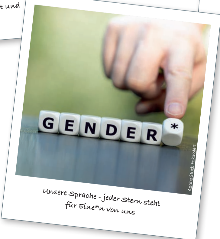
Unsere Sprache – jeder Stern steht für Eine*n von uns

Und so vielfältig ist die Belegschaft der VAG: Für den Verkehrsbetrieb arbeiten rund 2.000 Menschen aus 38 Nationen und vier Generationen. Das Alter liegt im Durchschnitt bei 46,2 Jahren. Fast 15 Prozent unserer Kolleg*innen arbeiten in Teilzeit. Rund zwölf Prozent der Belegschaft sind weiblich, darunter neun Auszubildende. Für ein eher technikorientiertes Unternehmen nicht ungewöhnlich, aber absolut ausbaufähig. Vom Azubi bis zur Ingenieurin finden bei der VAG alle ihren Platz.