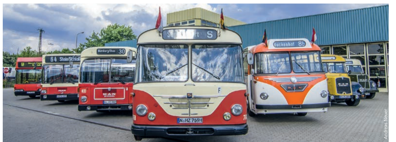
Dank der Freunde der Nürnberg-Fürther Straßenbahn verfügt die VAG über schöne historische Busse. Einsteigen und mitfahren!

Wenn die VAG feiert, kommt die Unterhaltung für große wie für kleine Gäste nicht zu kurz. Spannung pur verspricht sicher der Bus-Cup. Fahrer*innen der VAG und anderer Ver-