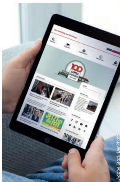
Der VAG-Blog: Infos auf einen Blick.

Wie steht es um die Verkehrswende? Wie läuft die VAG-Ausbildung ab? Und was passiert sonst im Netz? Über all das und vieles mehr kann die VAG auf dem Blog noch ausführlicher und tiefergehender berichten. Besonderen Wert legen die Macher*innen auf eine richtige Mischung aus Themenvielfalt und inhaltlichem Fokus. Was auch immer veröffentlicht wird – es muss zum Unternehmen passen, authentisch sein und den Nutzer*innen einen Mehrwert bieten. „Wir wollen unsere Fahrgäste überall dort erreichen,