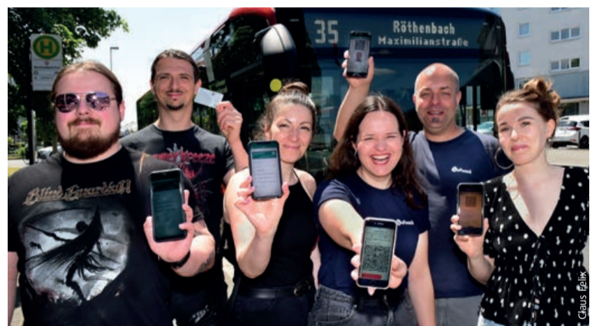
Bei den Mitarbeitenden kommt das Deutschlandticket Job besonders gut an.