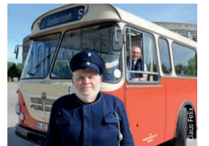
Alles bereit für die Entdeckertour.

Außerdem sind die Oldtimer bei Veranstaltungen als Shuttlebusse im Einsatz oder können für Ausflüge