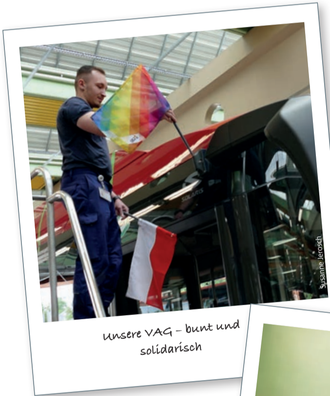
Unsere VAG – bunt und solidarisch

Zur Charta der Vielfalt gehört auch die Diversity Challenge, bei der junge Arbeitnehmer*innen ihre Vision von einer vielfältigen Arbeitswelt entwickeln sollen. Zehn Azubis der N-ERGIE und VAG haben diese Herausforderung angenommen. Unter dem Motto „Vielfalt vernetzt“ haben sie ein Format entwickelt, bei dem sie mit Mitarbeitenden im Konzern ins Gespräch kommen. Den Austausch halten sie in Videos fest. Denn genau der unvoreingenommene, permanente Austausch hilft uns, voneinander zu profitieren und kreative Lösungen für die Herausforderungen unserer Zeit zu entwickeln!