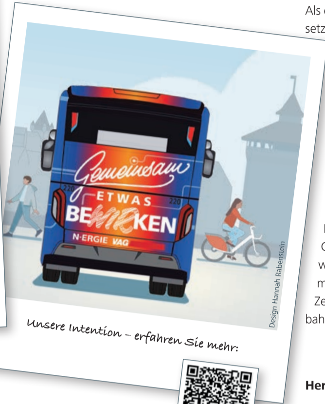
Unsere Intention – erfahren Sie mehr:

von Vielfalt, auch Diversity genannt. Die Initiative wurde 2006 von Unternehmen und Politik gegründet und 2011 in einen Verein überführt. Schirmherr der Charta der Vielfalt e. V. ist Bundeskanzler Olaf Scholz. Gemäß eigenen Angaben haben bis heute mehr als 4.900 Organisationen die Charta unterzeichnet. Damit repräsentiert sie über 15 Millionen Beschäftigte. Ziel der Initiative ist, das Thema Vielfalt in der Arbeitswelt in Deutschland weiter voranzubringen und zu verdeutlichen, welche Chancen darin liegen.