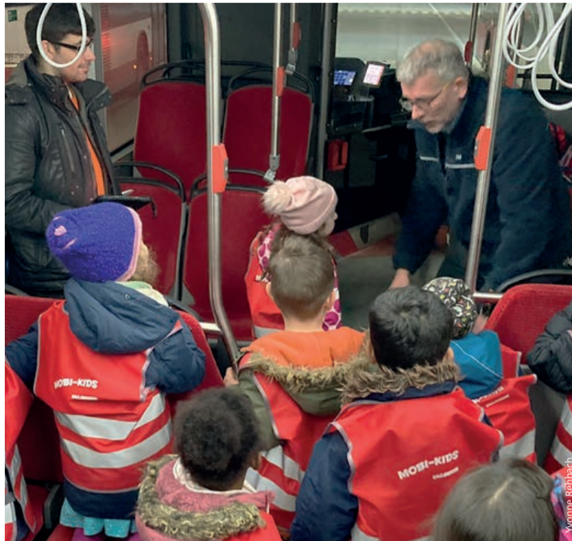
Wissbegierig: Kindergartenkinder aus Gostenhof waren auf Entdeckungstour.

Täglich sind rund 100.000 Kinder und Jugendliche mit der VAG unterwegs. Für sie ist der Öffentliche Nahverkehr eine der sichersten Möglichkeiten, selbstständig mobil zu sein. Deswegen bietet die VAG Nürnberger Vorschulkindern und Grundschüler*innen spezielle Programme an, mit denen sie den ÖPNV entdecken und kennenlernen. Die Mobi-