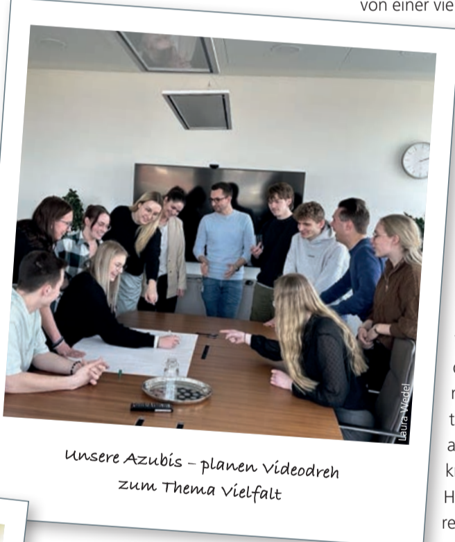
Unsere Azubis – planen Videodreh zum Thema Vielfalt

Die stärkste ÖPNV-Nutzung findet jedoch bei den Sechs- bis 24-Jährigen statt. Rund 5.000 unserer Abo-Kund*innen sind über 80 Jahre alt. Unsere längsten Vertragsverhältnisse bestehen seit 1981. Und alle werden seit 2002 von unserem paritätisch besetzten Fahrgastbeirat vertreten.