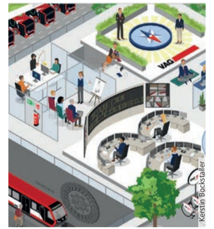
Mit eLearning aus- und weiterbilden.