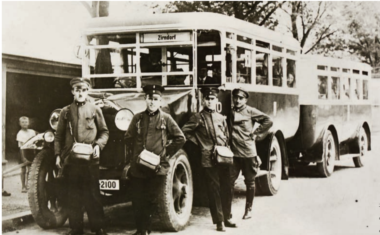
1925: Hochrahmen-Omnibus mit Anhänger. Neben dem Fahrer waren im Bus und Anhänger drei Schaffner im Einsatz.