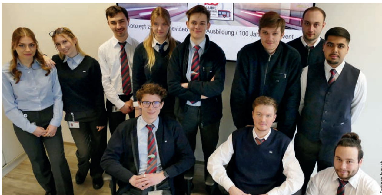
Echte Teamarbeit: Azubis aus dem ersten Lehrjahr planen ihren Auftritt bei 100 Jahre Omnibus.

Einerseits galt es, Ideen zu entwickeln, andererseits mussten diese mit Fakten unterfüttert werden, denn am Ende sollte ein möglichst umsetzbares Konzept stehen. Also haben sie eine Bestandsaufnahme gemacht, was als Ausstattung für ihren Stand bereits zur Verfügung steht und wie die Platzverhältnisse vor Ort sind. Das Ganze haben sie mit Plänen für den Auf- und Abbau, die Standbesetzung sowie den anfallenden Kosten hin-