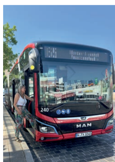
Stets aktuell: Besetzungsgrad von Bussen.

Ganz so einfach ist es in der Praxis jedoch nicht. So geriet das Projekt beispielsweise durch die Corona-Einschränkungen ins Stocken. Denn zunächst einmal mussten Daten gesammelt werden. Und das war durch den Fahrgastrückgang während der Pandemie nicht möglich. Die gewonnenen Daten sind nicht nur für Fahrgäste interessant. Auch für die interne Planung bei der VAG sind sie überaus wertvoll. Es lässt sich z. B. daraus ab-